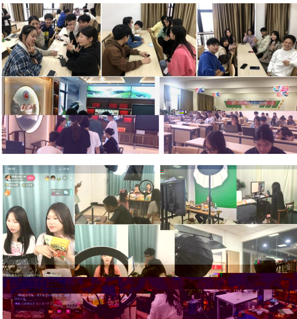
图 组织学生开展实习实训