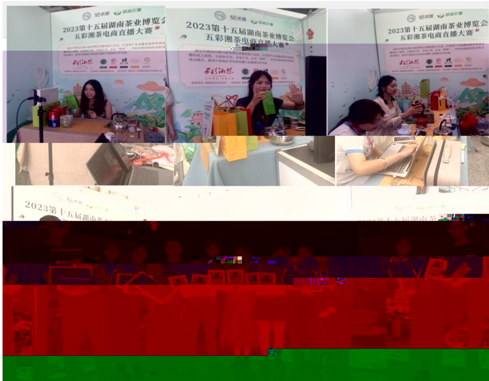
图 “湖南省第十五届茶博会” 电商直播比赛现场

播和方的，短 得的步。 队比 10多单、单， 包但不、等多个，的 和队得的高度。的 得不对公的，更对参 付出和的充分定。