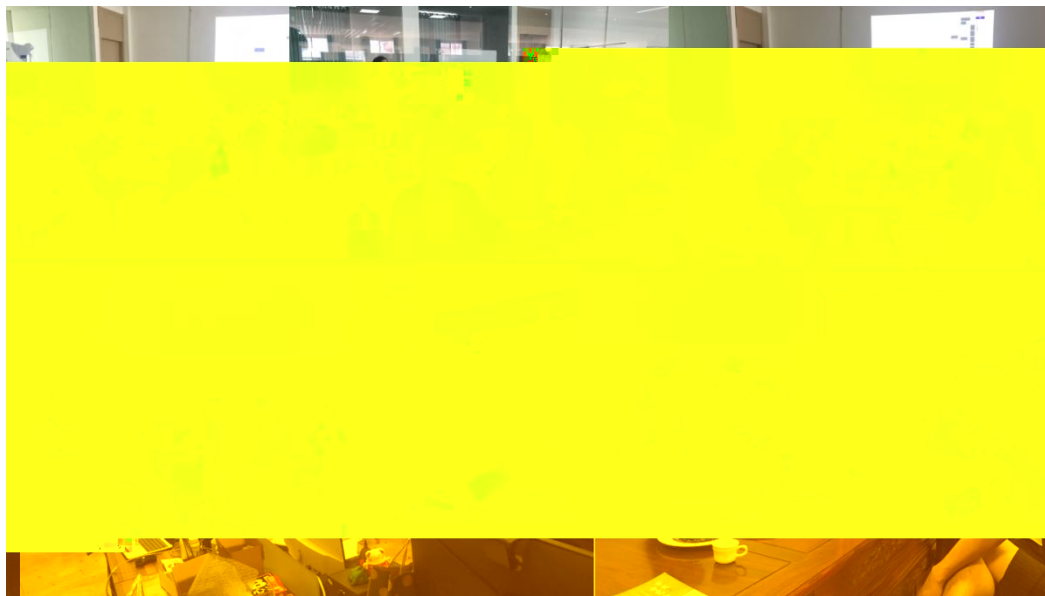
图 特邀企业专家来基地为学生进行专业培训

地 2023 地 ( 2), 供 宝贵的 。 过 的分 , 度 、 场变 , 对电 播 的 。 不 的 储备, 高 操 , 的 发 奠定 础。 措 合 的 度, 地 合 的 。